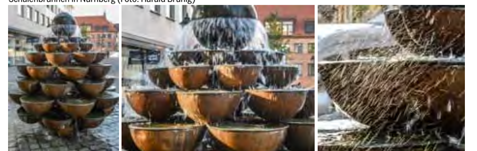
Schalenbrunnen in Nürnberg

BERNHARD VON CLAIRVAUX (1091-1153), französischer Mystiker